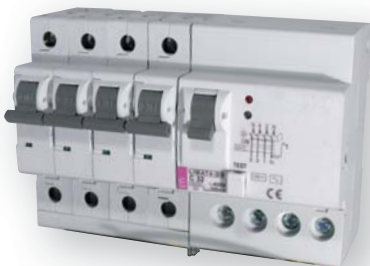
LIMAT4-DN (Posiada świetlną sygnalizację przyczyny jego zadziałania)