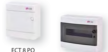
ECT 8 PO