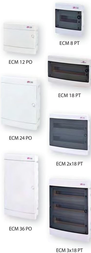
ECM 8 PT